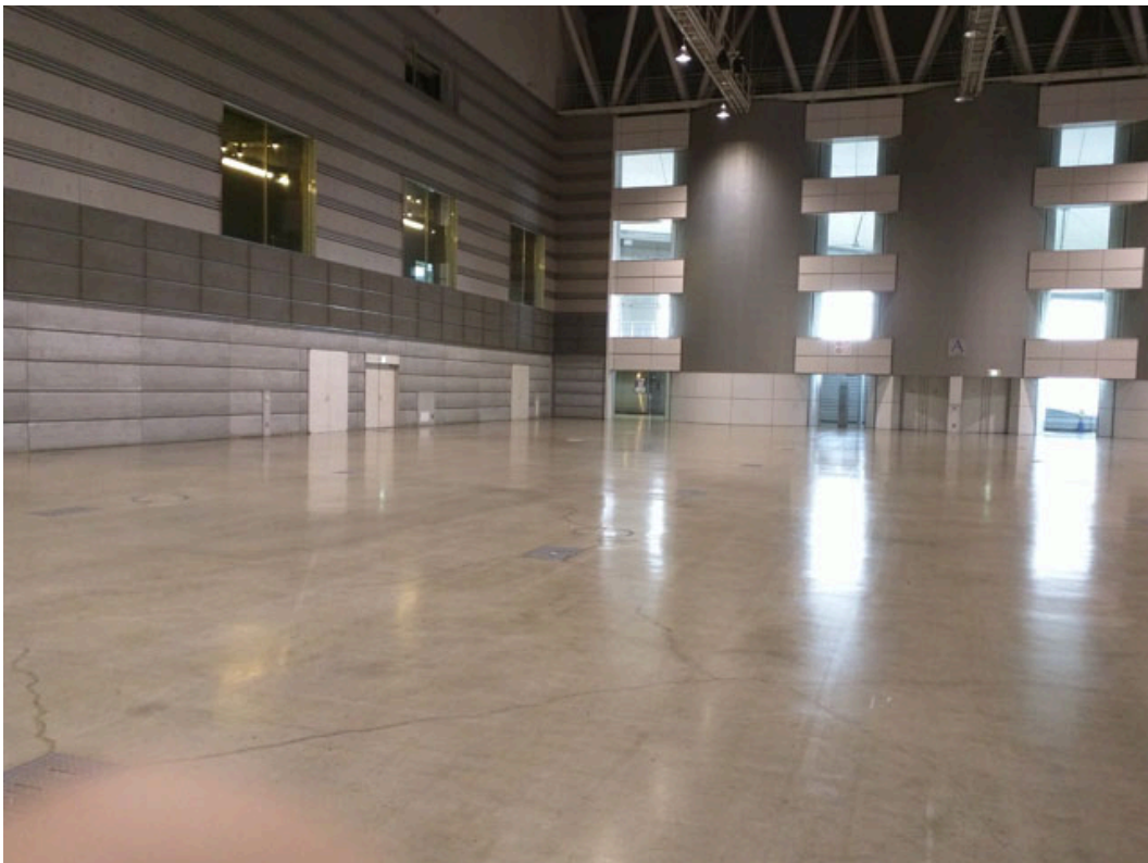
図 5 展示ホール A 展示会場内