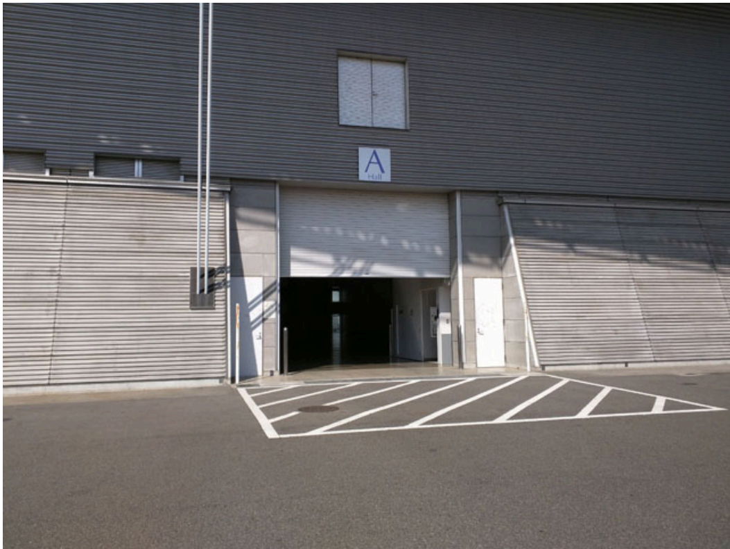
図 4 展示ホール A 機材搬入口