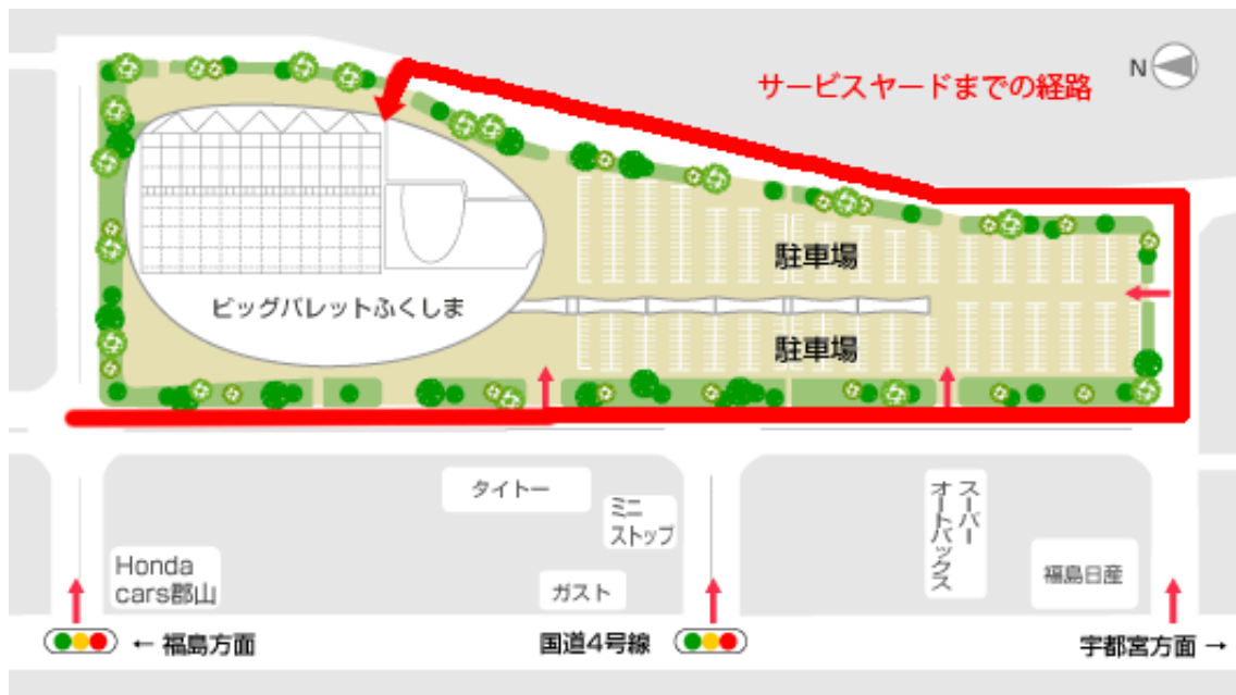
図 6 会場全体のレイアウト