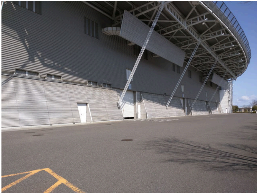
図 3 展示ホール（サービスヤード付近）