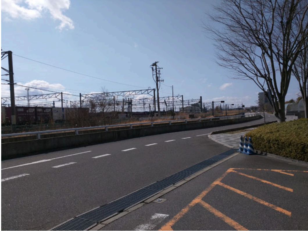
図 2 展示ホール（サービスヤードへの側道／展示ホール北入口脇）