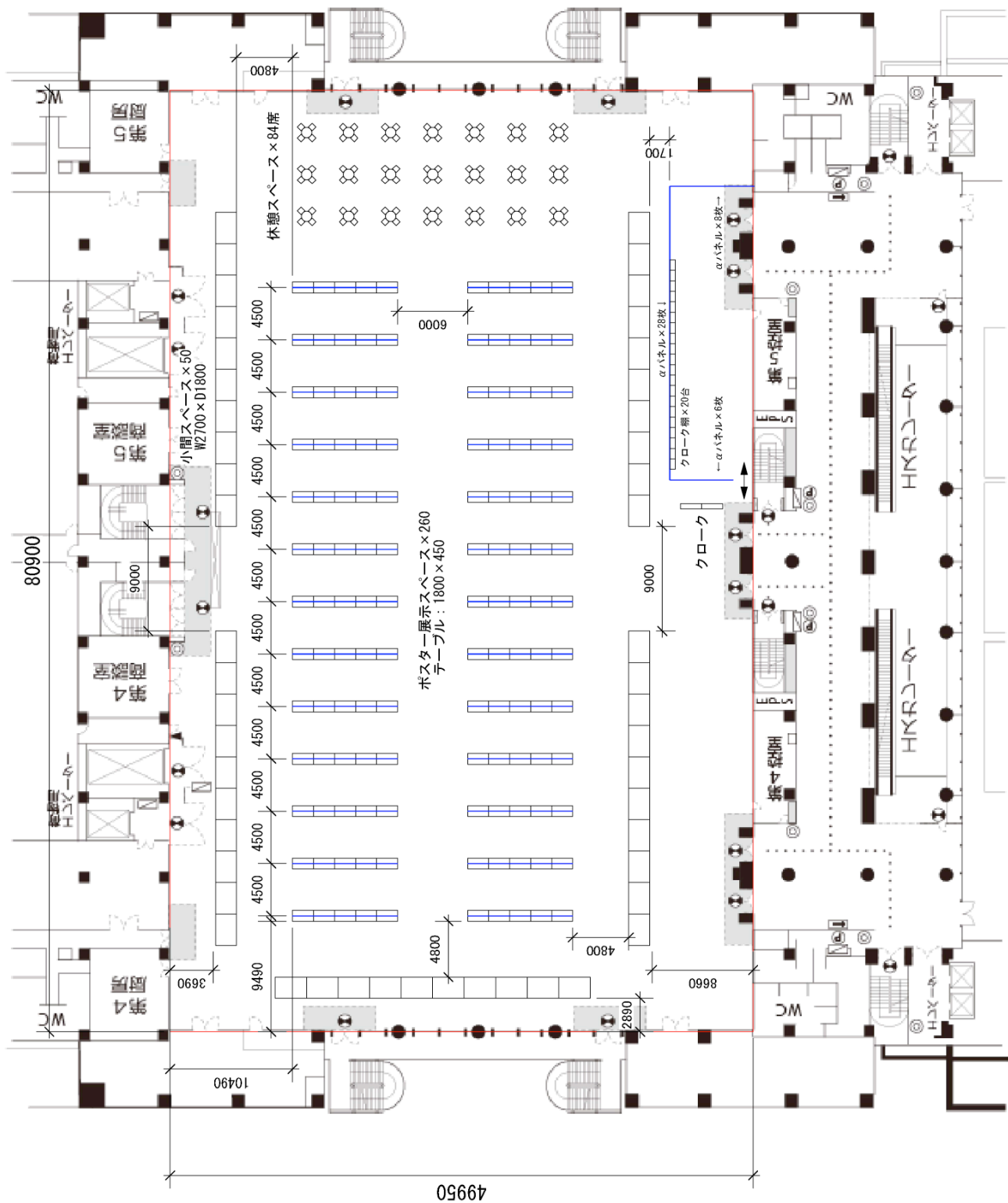
図2 展示会場予定図 (みやこめっせ3F 第三展示場)